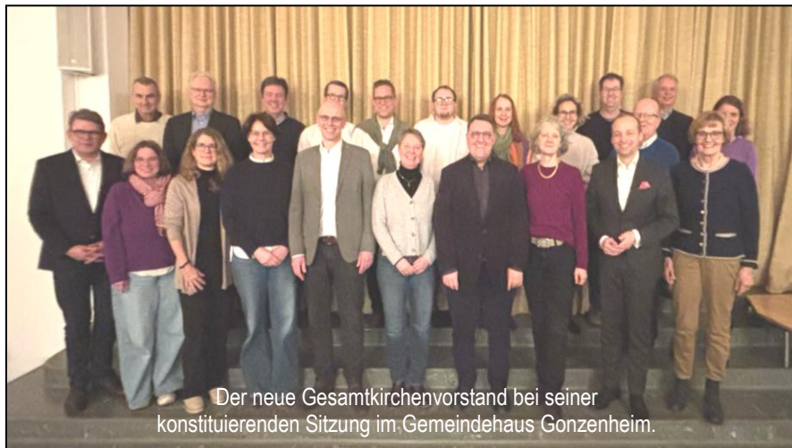
Der neue Gesamtkirchenvorstand bei seiner konstituierenden Sitzung im Gemeindehaus Gonzenheim.