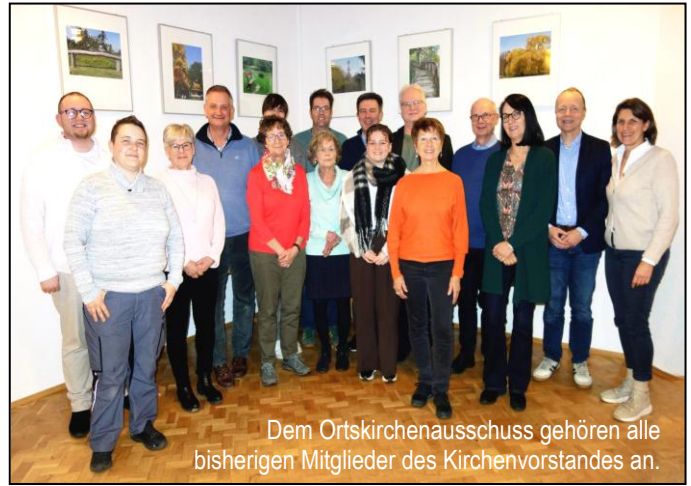
Dem Ortskirchenausschuss gehören alle bisherigen Mitglieder des Kirchenvorstandes an.